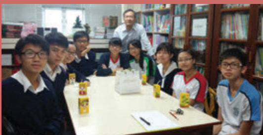
與基元及師生交流

交流的得著遠比我口述、書寫的多，但結識不少「戰友」，必然是我今次交流最大的得著。