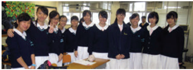
在友校認識到一班好朋友

另外，他們利用小組形式上課，經常就著課本問題跟同學討論，學習氣氛熱烈。不過可能兩校的課程不一，當遇到未學過的課題時，我就較難理解。