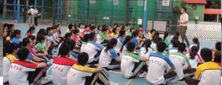
中五級在西貢北潭涌保良局渡假村進行訓練

5A 最寶貴的是能夠堅毅地達成自己訂下的目標，否則即使目標再簡單，也不能達成，機會要靠自己把握。 5B 我學到懂得感恩，懂得團結，懂得與同學分享，因為失敗是成功的開始，愈難愈應該奮鬥！盡力！永不後悔！