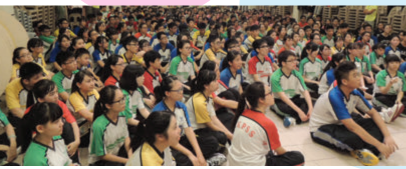
中五級同學於晚上聽教練分享

5E 最寶貴的是能夠堅毅地達成自己訂下的目標，否則即使目標再簡單，也不能達成，機會要靠自己把握。