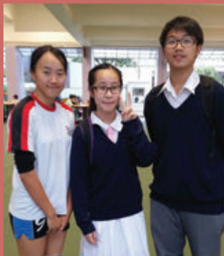
在基元得到的友情

最後，感謝友校和接待我們的同學。課堂上的照顧、午膳的安排，一切都很有心，令人欣喜難忘，留下了美好的回憶。